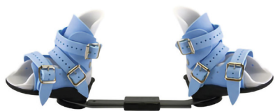
Fotabduktionsortos ("Ponseti brace") från C-pro direct.

Vanliga hjälpmedel som förskrivs för dessa barn är prefabricerade fotabduktions-ortoser, skor och inlägg samt emellanåt specialanpassad behandlings-KAFO.